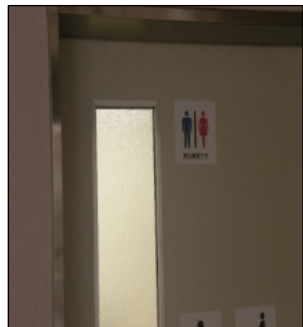
市役所内の男女共用トイレ

その後、事務局から今年度の活動方針など五議案が提案され、全て承認されました。枚方市は、一九九三年に「人権尊重都市宣言」を出し、二〇〇四年には「人権尊重のまちづくり条例」を制定して