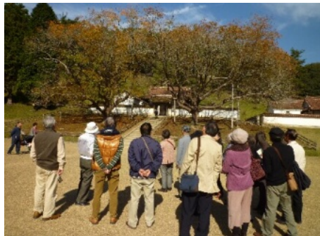
昨年、閑谷学校で楷の木を見る参加者